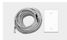
Kit comando afastado