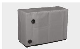
Capa de hibernação